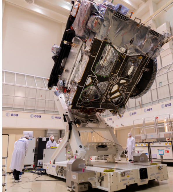
Préparation de JUICE en salle blanche dans les laboratoires de l'ESA aux Pays-Bas, en vue d'une phase de tests.

Les scientifiques analyseront les données de l'instrument MAJIS (Moons And Jupiter Imaging Spectrometer) pour déterminer les propriétés des glaces et minéraux présents à la surface des lunes de glace. MAJIS fournira un nouvel aperçu de l'état actuel ainsi que de l'activité passée de la surface et du sous-sol ainsi que de l'environnement spatial des lunes de Jupiter. La haute résolution spectrale et spatiale de l'instrument sera en effet un atout pour étudier l'atmosphère ténue des grandes lunes de glace, mais aussi les petites lunes et anneaux de Jupiter. Özgür Karatekin est Co-I de l'instrument, dont l'ORB a contribué à caractériser les détecteurs.