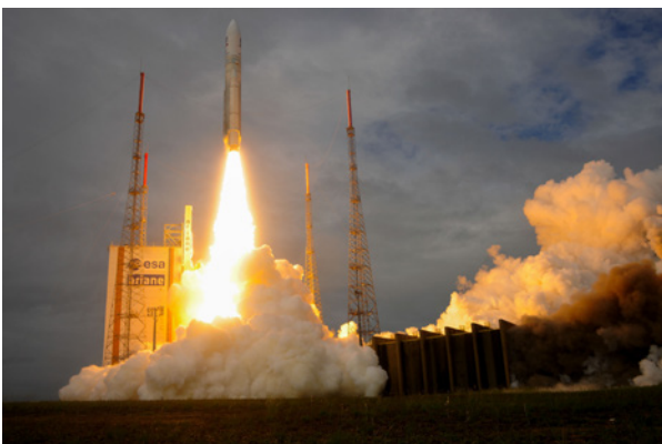
Décollage de la sonde JUICE à bord d'une fusée Ariane à Kourou.