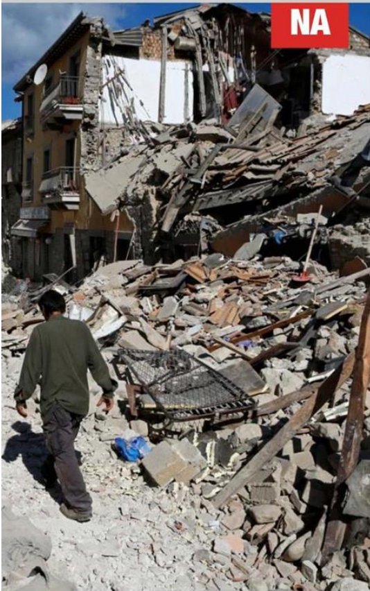
De schade van de aardbeving is niet te overzien. Vooral in het historische stadje blijft er van de huizen vaak niets meer dan puin over. Enkel de kerktoeren ongeschonden uit de aardbeving te zijn gekomen.